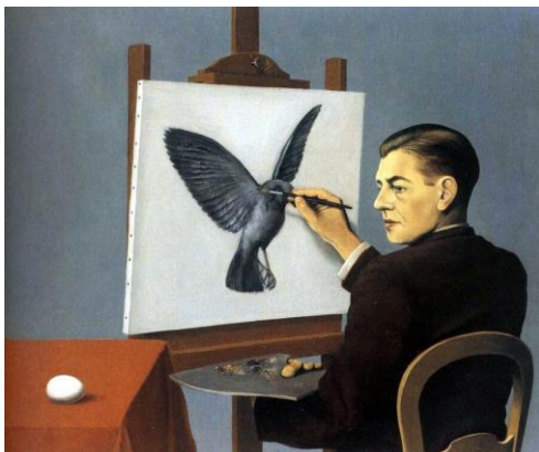
RENÉ MAGRITTE, LA CLAIRVOYANCE, 1936