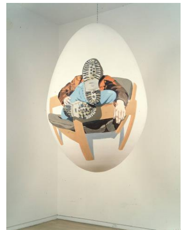
SARAH LUCAS, I KNOW WHAT I LIKE IN YOUR WARDROBE, 1996