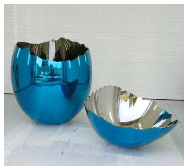
JEFF KOONS, CRACKED EGG, 1994-2006