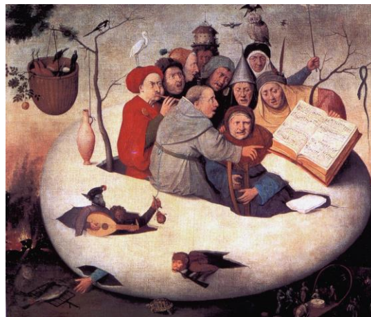
HIERONYMUS BOSCH, CONCERT IN THE EGG, 1561