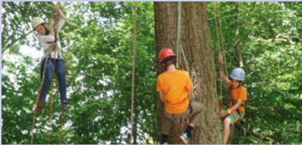
Aktion in der Sporterlebniswoche