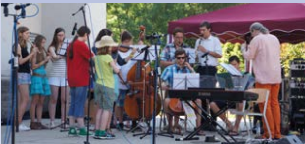
Auftritt der MPG-Musiker in Pasing